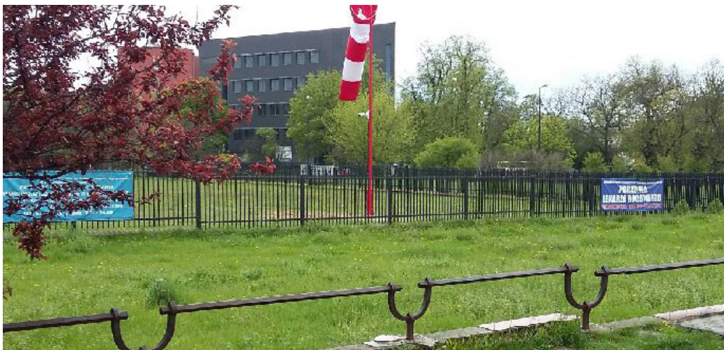
Widok ogrodzenia od strony przystanku przy al. Kraśnickiej